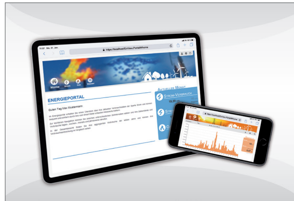
Browser, Smartphone, Tablet: Die Energiedaten der Letztverbraucher können jederzeit von überall abgerufen werden

IDSpecto.enVIEW.Portal visualisiert Verbräuche aus Zeitreihen und Registerwerten aller messbaren Sparten (wie z. B. Strom, Gas, Wasser, Wärme) und die hierfür konkret anfallenden Kosten. Nutzer erhalten damit alle relevanten Informationen über ihre Energie, und das zu jeder Zeit, von überall und auf einen Blick. Ob im Browser, via Tablet oder Smartphone: Die Darstellung wird für die jeweiligen Endgeräte optimiert. Neben den erfassten Messwerten von „Heute“ bietet enVIEW.Portal auch einen „Ausblick auf Morgen“. Die Prognosefunktion zeigt auch prognostizierte Verbräuche und Kosten für die nächsten Mess- und Abrechnungsperioden an.